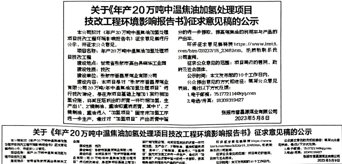
图4 2023年5月8、9日报纸公示图片